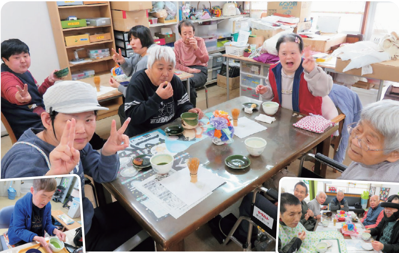
クリエイティブグループ茶話会