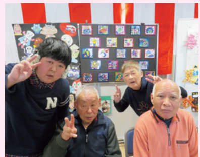
通所グループ「スタンドグラス」