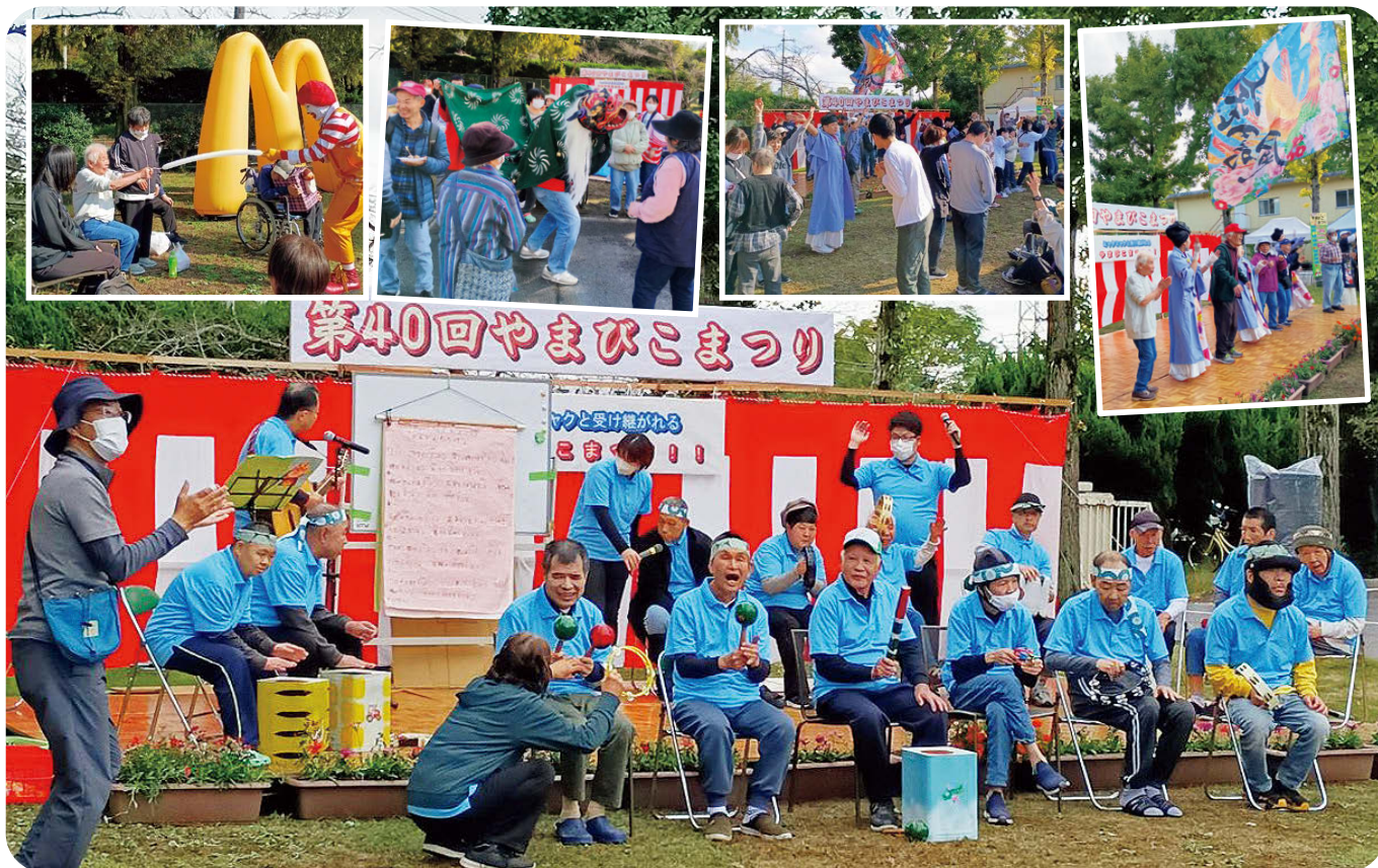
第40回やまびこまつりより(4面に関連記事)

発行 社会福祉法人 旭川荘 いづみ寮 〒701-2155 岡山市北区中原664-1先 TEL 086 - 275 - 1816 FAX 086 - 275 - 5646